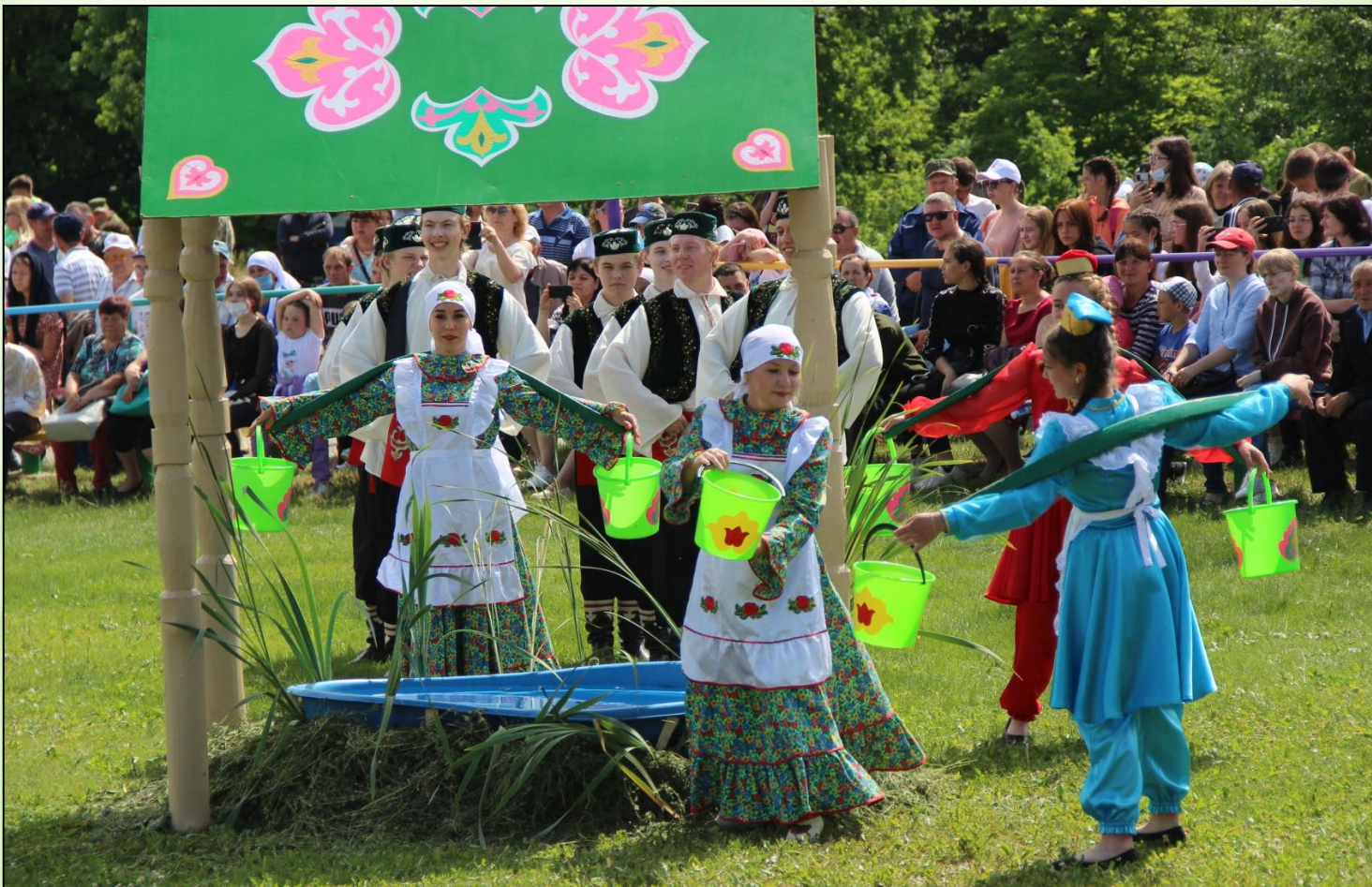
Шуточное соревнование - бег с коромыслом